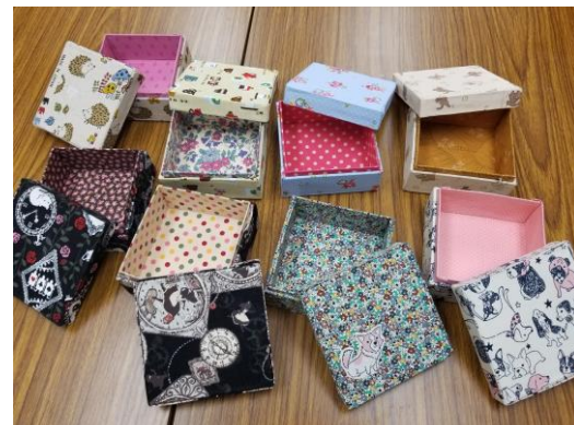
可愛い小箱「カルトナージュ」 2月の菜の花カフェで作りました。 何を入れようかな？