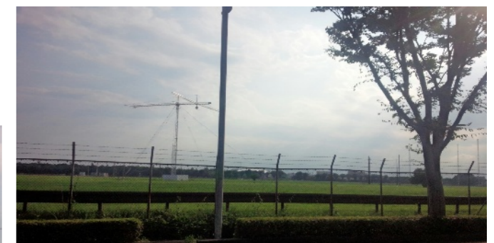
米軍通信基地 中新井からミュージズ方向