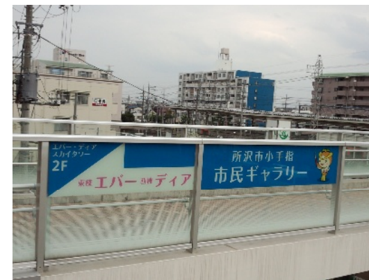
表示があってわかりやすくなりました