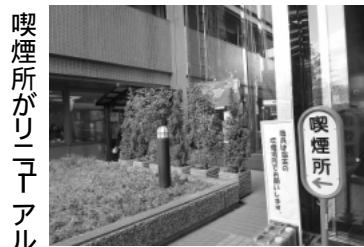
喫煙所がリニューアル

庁舎内の完全禁煙を実施した市役所の喫煙場所は、玄関外です。雨も降りかかり、煙が玄関に流れてくることもあります。今回、12 月議会で一般質問した屋根の整備が実現しました！吸煙機の設置も検討中です。(職員用は非常階段を降りた地下で雨ざらし。非常に環境が悪いと感じています。次は完全分煙できる職員用喫煙場所の整備を！) (ちなみに私は一切タバコは吸いません...)