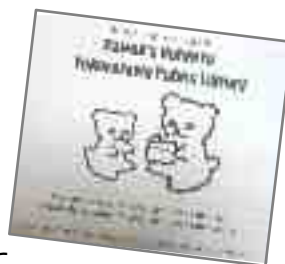
昨年要望した 外国人図書館利用ガイドが完成！(英語版)