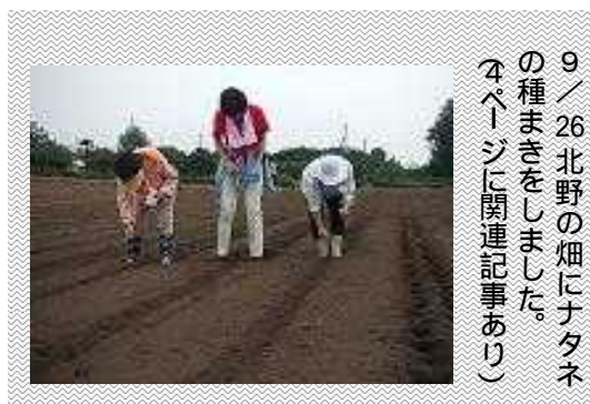
9/26北野の畑にナタネの種まきをしました。4ページに関連記事あり

また「富岡地区に、廃棄物第2最終処分場をつくらないことを求める請願」の紹介議員となりましたが、最終日投票で採択されました。